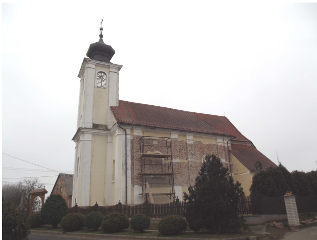
A templom levert északi homlokzata

A falak kiszáradását követően - jelenleg ebben a fázisban tart a felújítás - jöhet azok újravakolása és színezése.