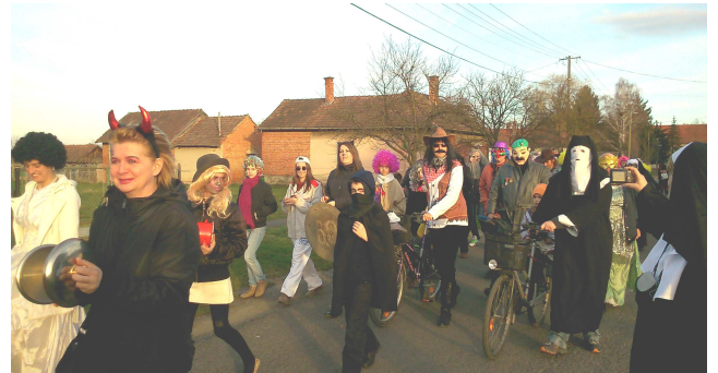
Farsangi felvonulás a település utcáin

Március 1-jén egy új, remélhetőleg hagyománnyá váló programot szerveztünk, Télűző farsangi jelmezes felvonulással és batyus családi bállal vártunk minden kedves érdeklődőt.