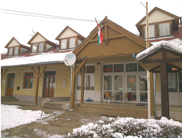
Ráfér a felújítás a közösségi ház bejára