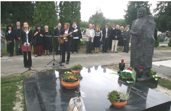
Utassy József Kossuth-díjas költő síremlékének avatása 2013. augusztus 27-én