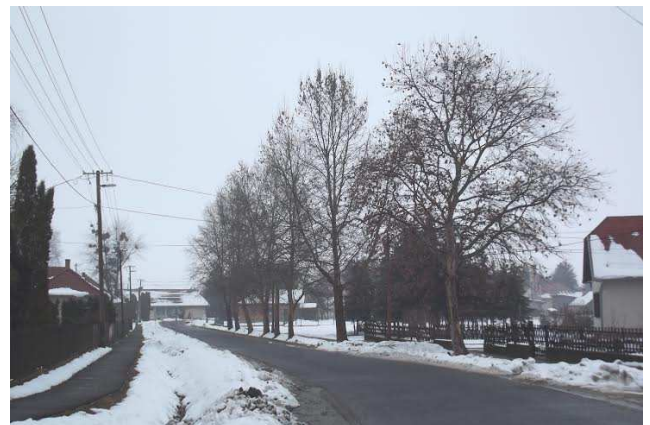
Téli utcakép a még meglévő platánokkal