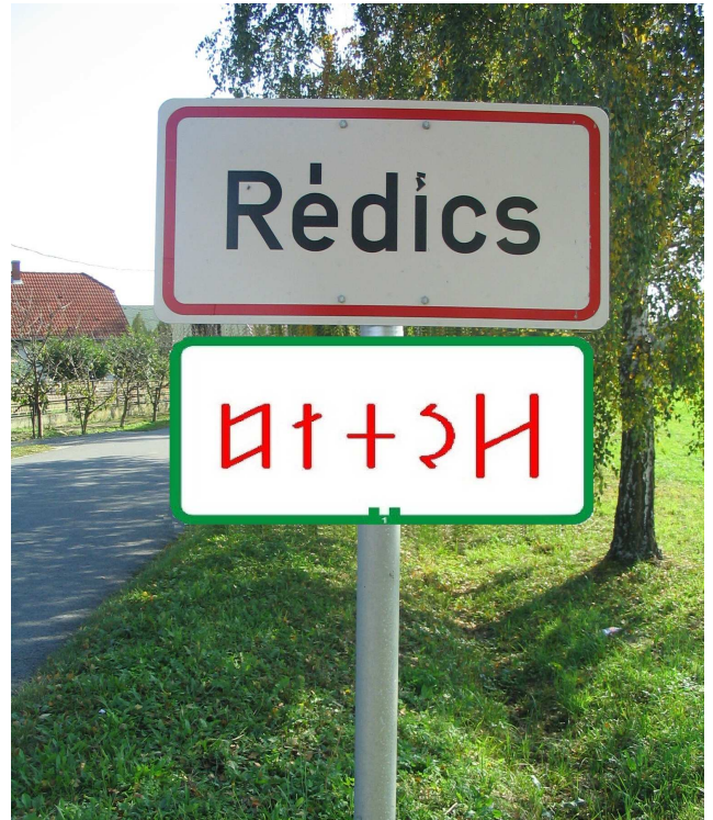
Rovásos táblaterv - A kép illusztráció

A Képviselő-testület február 27-i ülésén jóváhagyta a táblák kihelyezésére vonatkozó előterjesztést, s így még a nyár közepéig kihelyezésre kerül a település 4 pontján az alábbi tábla, mely RÉDICS nevét tartalmazza rovásírással.