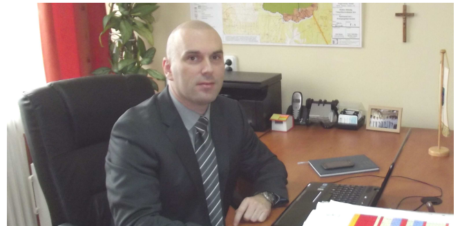
Tóth Lajos polgármester

Nagyon bízom abban, hogy a kezükben tartott új lap még nagyon sok számot meg fog érni, s hasznos eszköze lesz annak, hogy a helyi információk minden családhoz eljuthassanak.